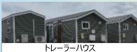
トレーラーハウス