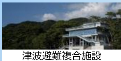
津波避難複合施設