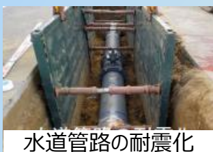
水道管路の耐震化