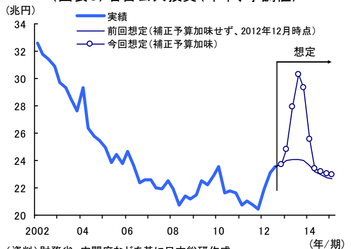
（図表5）名目公共投資（年率、季調値）

(注1)補正予算が2013年2月に成立すると想定。 (注2)公共投資の顕在が3月から6ヵ月後にピークを迎え1年程度で収束すると想定。