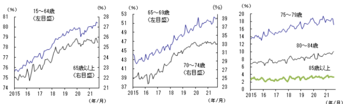
【図表3】 年齢階層別の労働力率の推移

今後、新型コロナの感染収束の動きが定着するにつれ、酒類提供についての時短要請解除やGoToトラベルの再開なども実施される見込みとなっています。しかし、回復が遅れた対面型サービスでは、他産業への人材流出もあり、失業者の職場復帰だけでは労働力が足りず、人手不足が深刻化する恐れがあります。労働力率の上昇についても、70代以外の層については既に新型コロナ前のトレンドに戻っており、緊急事態宣言解除を機に労働力増加ペースが大幅に加速することは期待薄です。また70代雇用者についても、過去の景気後退期に見られたように、いったん、引退してしまうとなかなか労働市場に戻ってこない可能性が高いとみられます。