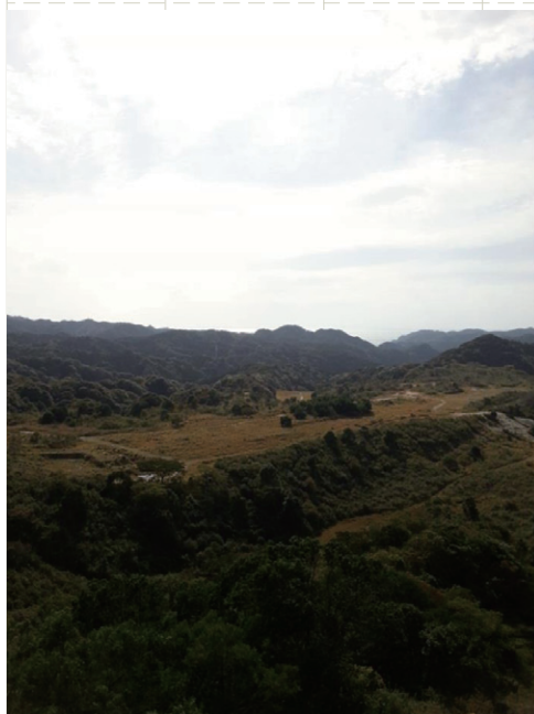
現地の様子

そのため、新たなる事業主体者候補として、プラントエンジニアリング、発電事業者、建設事業者などにアプローチし、用地賃貸という比較的簡易なスキームも見据え検討していくこととした。