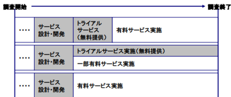
有料によるサービス提供のパターン（例）

有料サービスを提供する場合、サービス設計・開発やそれに付随する検討作業、有料サービス提供前のトライアルサービス提供、有料サービス実施中の本調査に係るアンケート実施等を行う際に必要となる人件費・事業費等については、本委託事業費の範囲内となる。また、当該実証事業ではライフデザインサービスの提供をその範囲としており、その後の各種サービス利用に伴う必要は本委託事業費の範囲外となる（ライフデザインを行った後の資産運用・学習支援・結婚支援・健康管理等のサービス利用費を当該委託費で賄い無償で各種サービスをライフデザインプログラム受講者に提供することはできない。）。