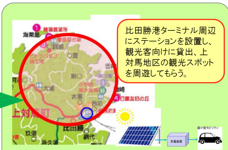
<観光利用のイメージ>