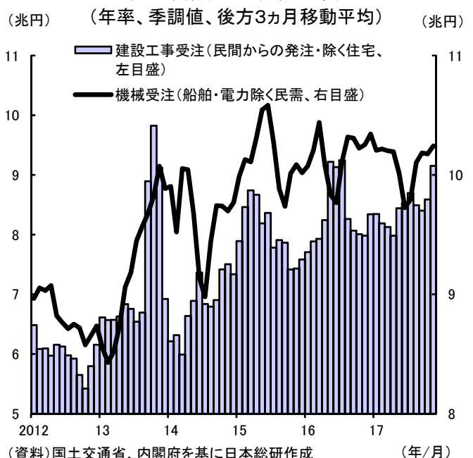
（図表2）機械受注と建設工事受注