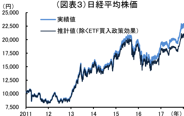
(図表3)日経平均株価